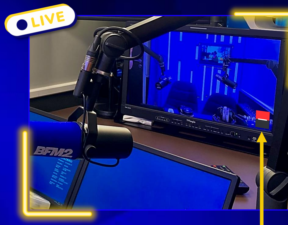
VOTRE LOGO (exemple avec société générale)

En intégrant votre logo dans un format de diffusion moderne et interactif, vous positionnez votre marque dans l'innovation médiatique.