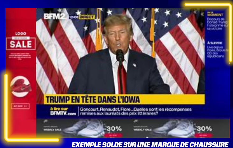
EXEMPLE SOLDE SUR UNE MARQUE DE CHAUSSURE

Cette configuration optimise l'espace écran pour diffuser à la fois l'actualité et votre publicité, garantissant une visibilité maximale et continue pour votre marque, sans interrompre le flux d'actualités.