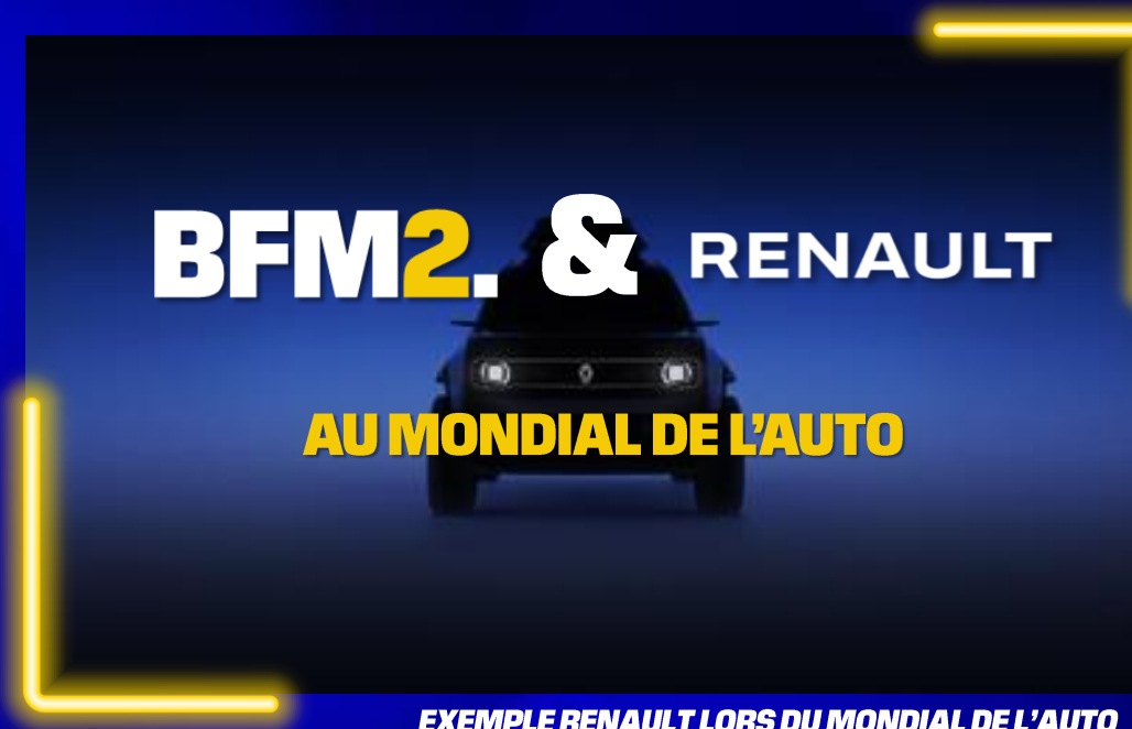
EXEMPLE RENAULT LORS DU MONDIAL DE L'AUTO

Profitez d'une association avec des événements reconnus du public, renforçant l'image de votre marque en la liant à des moments culturels.