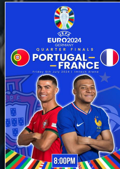
QUART DE FINALE EURO 2024 5 juillet 2024

D'audience dans le débrief de l'After Foot