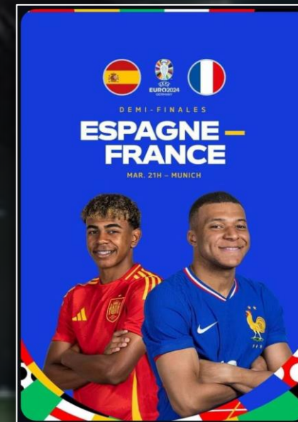
DEMI-FINALE EURO 2024 9 juillet 2024

D'audience dans le débrief de l'After Foot