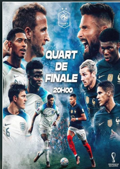
QUART DE FINALE COUPE DU MONDE 2022 10 décembre 2022