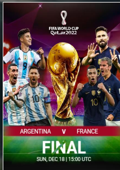
FINALE COUPE DU MONDE 2022 18 décembre 2022

D'audience dans le débrief de l'After Foot